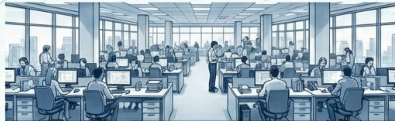
Nagyvállalati ügyfélszolgálati központok

Képes több ügyfelet kezelni egyidejűleg.